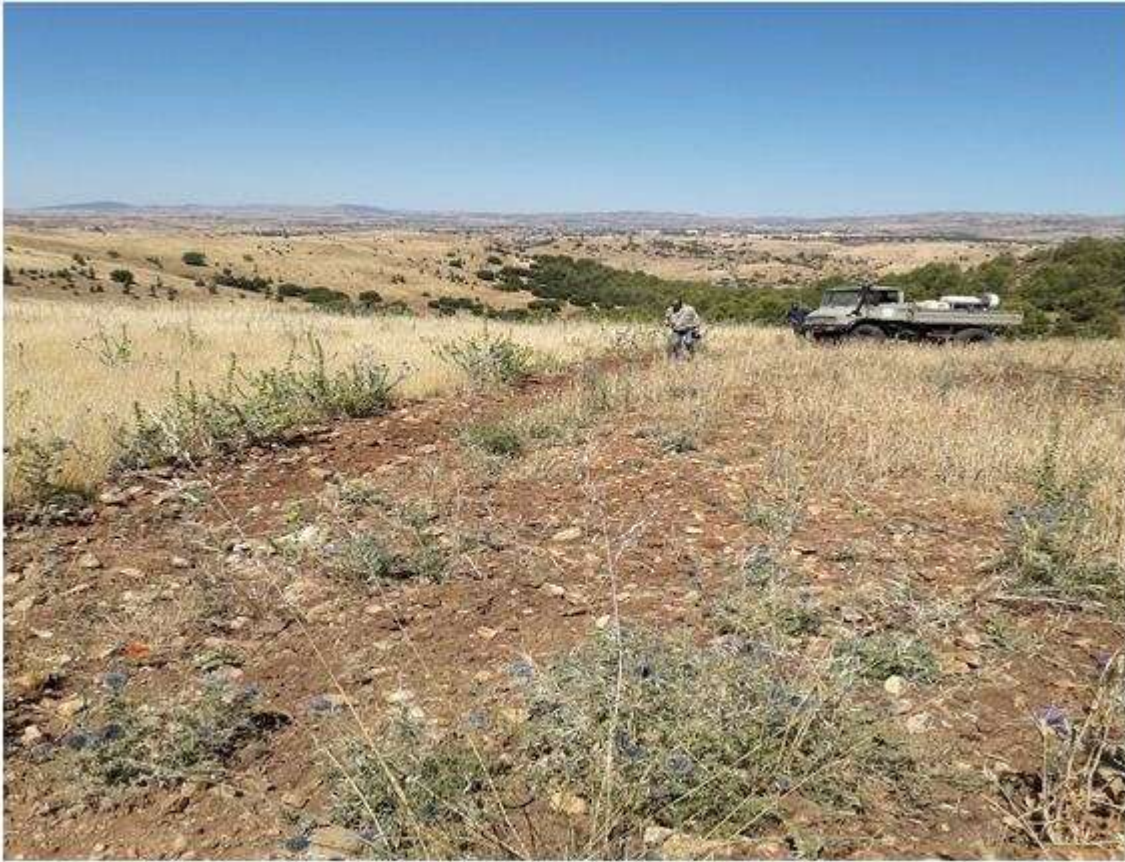
Traitement contre les sauteriaux au niveau de la wilaya de Médéa

Pour le criquet marocain et les sautereaux, de nouvelles infestations composées de jeunes ailés et des larves de différents stades ont été signalées et traitées au niveau des wilayas de Médéa, Batna, Bejaia et Bordj Bou Arreridj sans aucun dégât sur les productions et le patrimoine agricoles.