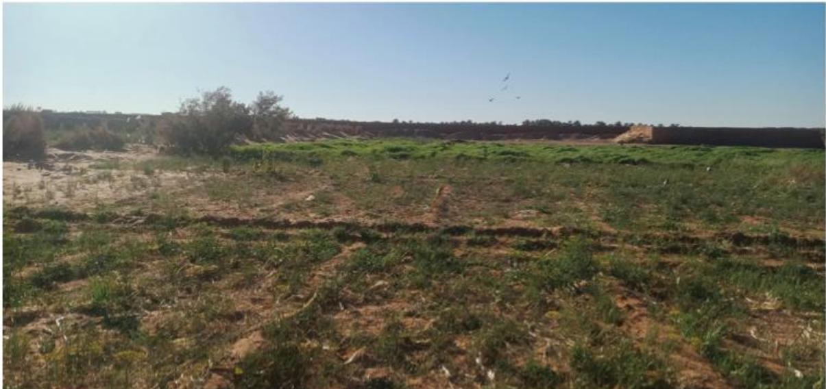
Etat de la végétation au niveau du grand sud

Concernant les conditions éco-météorologiques, le temps est resté sec au niveau des zones couvertes par les prospections. La végétation annuelle et pérenne persiste verte et favorable au maintien des criquets au niveau des biotopes naturels et les périmètres agricoles. Cependant, les températures nocturnes basses freinent la maturité leurs maturités.