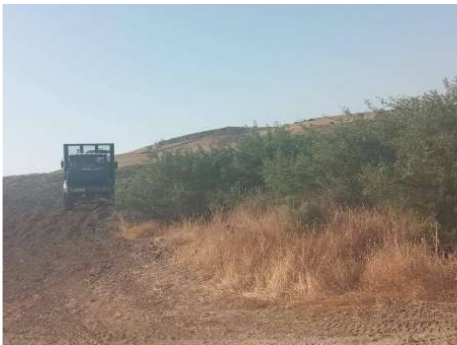
Traitement contre les sauteriaux au niveau de Tissemsilt (Photos INPV, juillet 2023)

De nouvelles infestations de sauteriaux ont été signalées et traitées au niveau des deux wilayas de Tissemsilet et Djelfa.