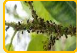
المن Pucerons (كل مناطق الحمضيات)