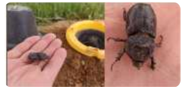
حشرة خنفساء وحيد القرن L'Oryctès ( الوادي, تبسة)