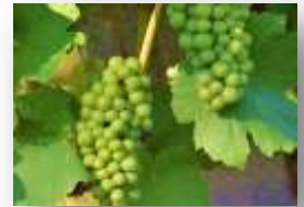
طور اكتمال العناقيد

- الوسط، الشرق و الغرب: من اكتمال العناقيد الى تلون الثمار.