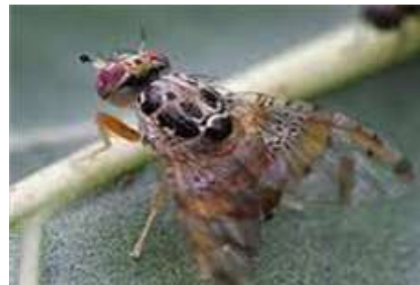
ذبابة البحر الأبيض المتوسط (وهران/قسنطينة/تيزي وزو/الشلف/باتنة).