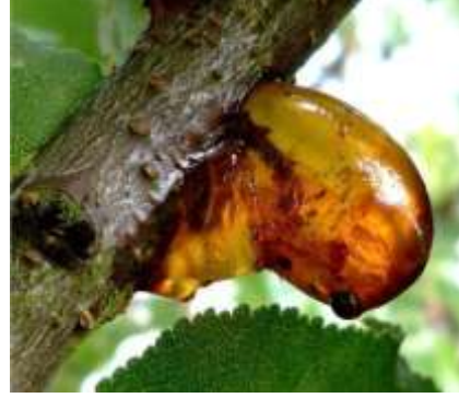
التصمغ على الخوخ و المشمش (وهران، عين تيموشنت).