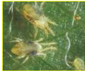
العنكبوتيات Acaris (الطارف، عنابة)