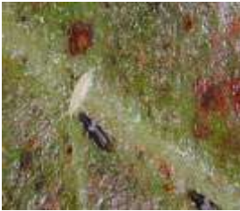
تريبس Thrips (مستغانم، غليزان)