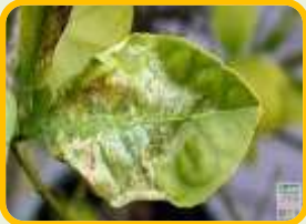
حفارة الطماطم Mineuse