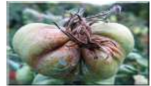
البياض الزغبى Mildiou (سكيكدة، عنابة، قلمة، الطارف)