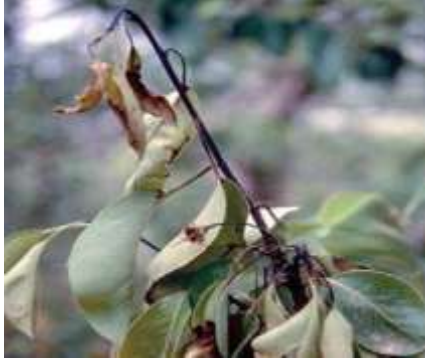
الملفحة النارية على الاجاص (تيزي وزو)