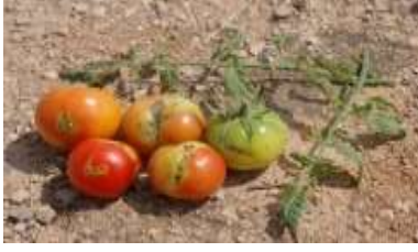
حفارة اطماطم Mineuse (الجزائر، بليدة، تيبازة)

لم تسجل أي أعراض أو إصابات في باقي المناطق