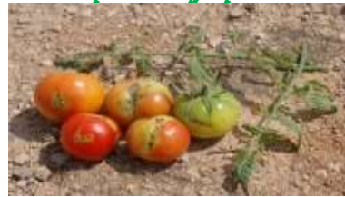
حفارة اطماطم Mineuse (مستغانم، غليزان وهران)