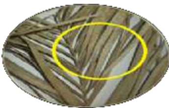
القشريات البيضاء Les cochenilles blanches (الدرار)