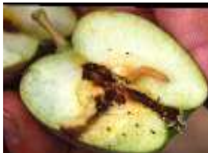
دودة التفاح (تيزي وزو، الطارف، الشلف، وهران)