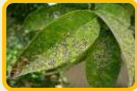
القشريات Les Cochenilles (وهران و البليدة)