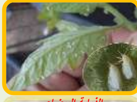
الذبابة البيضاء Aleurodes Blancs (كل مناطق الحمضيات)