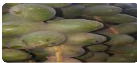
عنكبوت التمر (البوفروة) Le Boufaroua (غرداية, ورقلة, توقرت, المنيعه, الوادي بسكرة. المغير اولاد جلال)