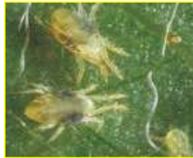
العنكبوتيات Acarions (مستغانم، غليزان)